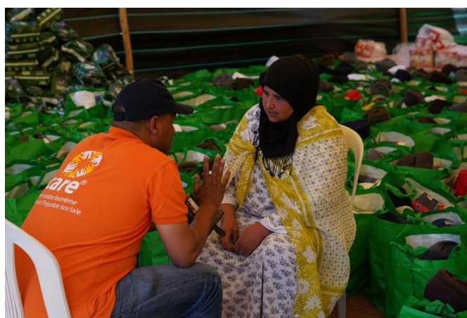
Maroc : soutien aux populations affectées par le tremblement de terre.

Depuis septembre 2022, CARE France, avec Coordination SUD, milite pour une aide humanitaire française plus ambitieuse. Nous avons produit des notes et rencontré les ministères, influençant la nouvelle stratégie humanitaire de la France (2023-2027) dévoilée fin 2023. Celle-ci inclut des avancées majeures comme le doublement des financements d'ici 2025, un accent sur l'approche genre et, pour la première fois, une attention au climat et à l'environnement dans la réponse humanitaire.