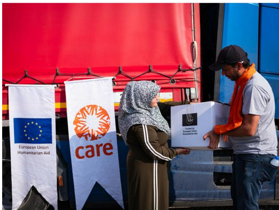
Turquie : distribution de kits d'hygiène aux populations affectées par le séisme.