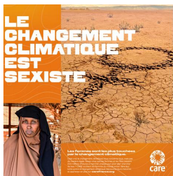
France : Visuel utilisé par CARE France durant la campagne Climate Change is Sexist