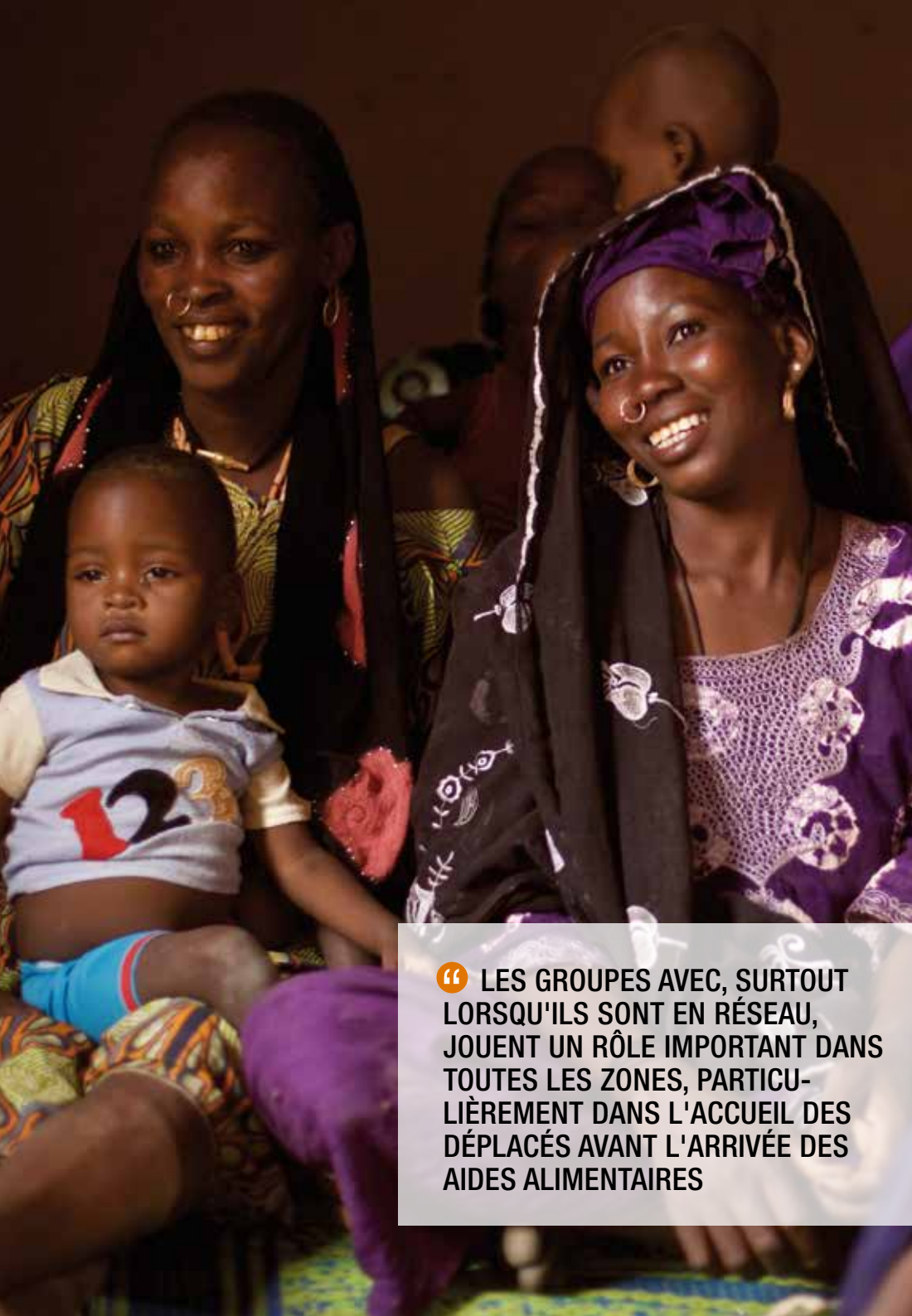
Une femme d'un village de Diffa, Niger, qui accueille des réfugiés et des rapatriés du Nigeria, a rejoint un groupe AVEC qui investit dans de petites activités économiques.

“ LES GROUPES AVEC, SURTOUT LORSQU'ILS SONT EN RÉSEAU, JOUENT UN RÔLE IMPORTANT DANS TOUTES LES ZONES, PARTICULIÈREMENT DANS L'ACCUEIL DES DÉPLACÉS AVANT L'ARRIVÉE DES AIDES ALIMENTAIRES