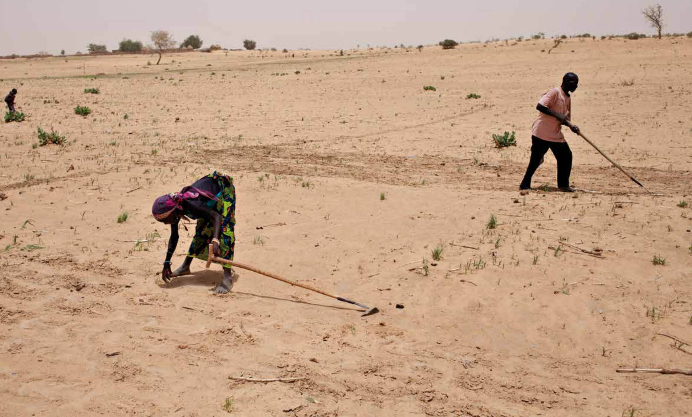
Un homme et une femme qui travaillent leur champ dans le paysage semi-arid du Niger. Dan Marké Wage, Niger